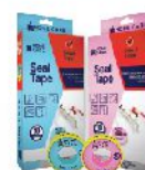
Isolasi Kran Air